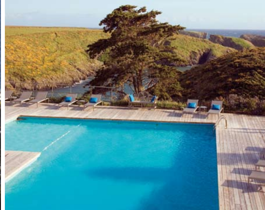
Deux piscines chauffées face à l'océan, l'une d'eau douce à l'intérieur avec jacuzzi, l'autre d'eau de mer à l'extérieure avec une terrasse accueillante qui domine la baie...