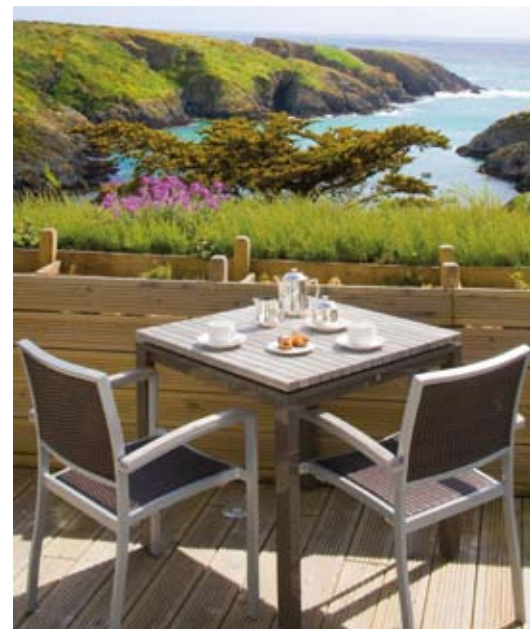
Une expérience inoubliable: déjeuner sur la terrasse dominant la baie de Goulphar.

Dans les décors classiques du restaurant 'Bleu manière Verte', on découvre que l'île calme et verdoyante inspire aussi d'autres talents: ceux du Chef Christophe Hardoin. Il propose une cuisine iodée et résolument orientée vers les produits de la mer, avec des menus différents chaque jour. Plus décontracté, le Café Clara est une autre invitation pour les gourmands, avec un extraordinaire buffet offrant tous les déli-