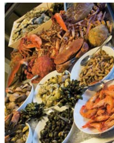
Au savoureux buffet du Café Clara, homard à volonté, langoustines, crevettes et huîtres, agneau ou boeuf de Belle-Île à 55€/pers.